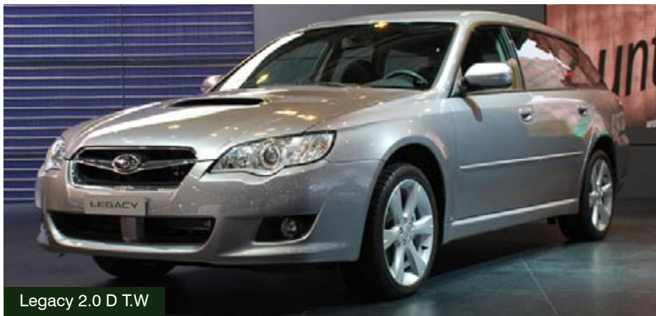
Legacy 2.0 D T.W

Medzinárodný autosalón v Ženeve je najdôležitejšou jarnou výstavnou motoristickou udalosťou v Európe a na jeho tohtoročnom 78. ročníku debutoval v stánku SUBARU motor BOXER DIESEL.