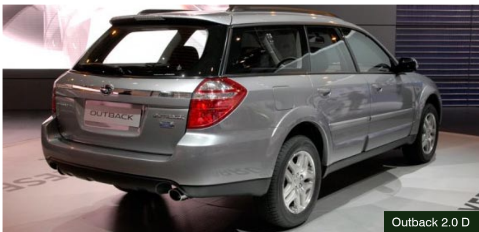
Outback 2.0 D