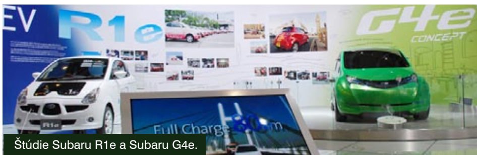
Štúdie Subaru R1e a Subaru G4e.