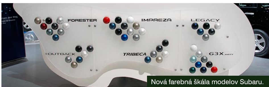
Nová farebná škála modelov Subaru.

Je to celosvetovo prvý motor s unikátnou konštrukciou protiahlých valcov, spojený s jedinečným pohonom firmy Subaru, Symmetrical AWD (pohon všetkých kolies), čím sa dosiahol štandard jazdného výkonu, aký poskytuje len Subaru. BOXER DIESEL bol predstavený v modeloch Legacy a Outback a zachováva výnimočné hodnoty zrýchlenia vďaka mohutnému točivému momentu v nízkych a stredných otáčkach. Vďaka svojim charakteristikám - excelentnej odozve plynového pedálu, zníženému treniu a redukovaniu zotrvačných síl, ktorých výsledkom je plynulá akcelerácia - si tento motor s výkonom 150 k a krútiacim momentom 350 Nm plne zasluhuje názov športový diesel. Oba modely nielenže spĺňajú emisné nariadenia normy Euro 4, ale vyznačujú sa aj prvotriednou hospodárnosťou medzi vozidlami s pohonom všetkých štyroch kolies, čím spájajú jazdný výkon s ohľaduplnosťou k životnému prostrediu.