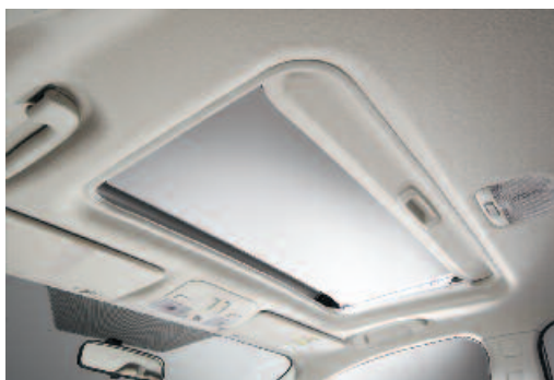
Veľké strešné okno spríjemňuje cestovanie a presvetľuje kabínu XV. Ovláda sa elektricky.