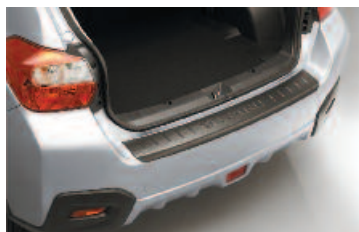
Vrchná ochrana zadného nárazníka