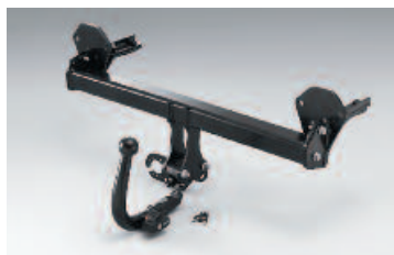
Ťažné zariadenie pre príves