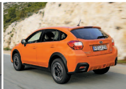
Plastová ochrana je na najchúlostivejších miestach masívnejšia.

súčasných modelov značky. Zaujímavé je, že tradičný otvor pre prívod vzduchu k medzichladiču turbu, ktorý je v ostatných modeloch na kapote motora, sa v prípade XV skryl v spodnej časti prednej masky.