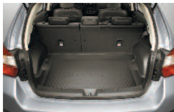
Vaňa batožinového priestoru