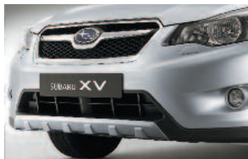
Ochranná lišta predného nárazníka