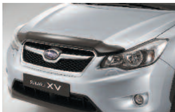
Ochranný kryt kapoty motora

Automobily Subaru majú už v štandarde takmer všetku mysliteľnú výbavu. Individualistom, ktorí chcú auto dokonale zladit' so svojím životným štýlom, značka ponúka originálne doplnky a príslušenstvo, vyrobené s rovnakým dôrazom na kvalitu ako samotný automobil. Sú zamerané na ochranu karosérie a interiéru, zvýšenie funkčnosti vozidla či úpravu jeho vzhľadu. Predstavujeme niektoré doplnky pre model XV. Kompletný zoznam príslušenstva nájdete v katalógu, informácie vám poskytne aj každý dealer Subaru.