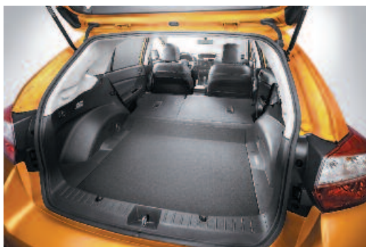
Dno batožinového priestoru sa dá v zadnej časti vyklopiť k nárazníku, čo eliminuje nakladací schodík.