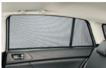
Rolety proti slnku pre zadné okná