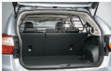
Mreža pre psy